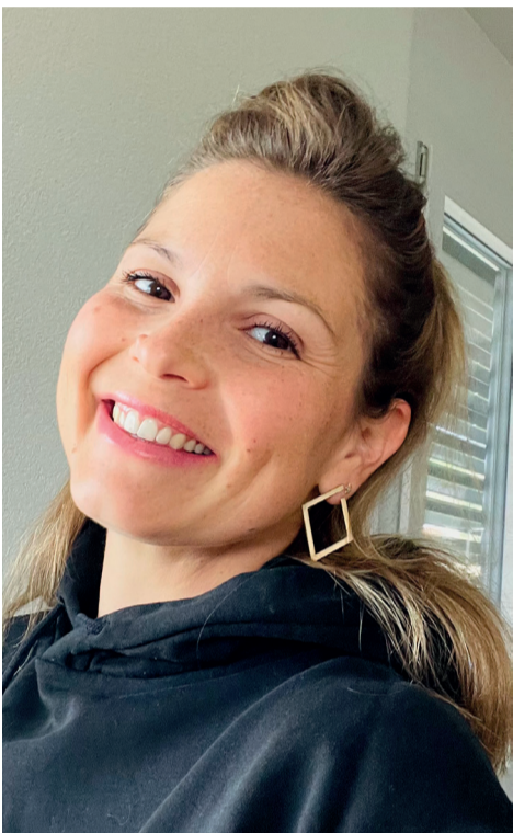
Le nouveau visage de l'école maternelle

Depuis la rentrée de septembre, l'école maternelle à Auboranges accueille 26 bambins et une nouvelle maîtresse. Désormais entièrement communale, cette structure est un marchepied, un petit escabeau, qui facilite et encadre les apprentissages initiaux. Les enfants y apprennent le « comment vivre en société » et les bases préscolaires. Des compétences utiles pour toute la vie qu'ils ont devant eux.