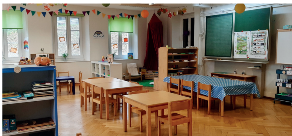
Un univers adapté aux petits

Lors de chaque matinée en maternelle, il y a un moment de lecture. En principe après la collation de la mi-temps. Une fois, alors que les enfants étaient déjà tous installés en rond et que Romy balayait les miettes avant de les rejoindre, une petite fille a