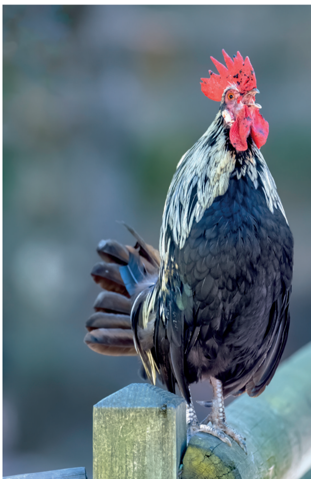
Oyez, oyez, le numéro 12 est arrivé

Le sport (comme le rire) est bon pour la santé : une jeune joueuse d'unihockey est à l'honneur dans